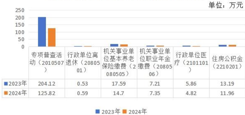
汉中市社会经济普查中心 一般公共预算拨款支出按功能科目分类

万元减少 1.23 万元，减少比例为-9.33%，原因是本单位人员较去年减少 1 人，住房公积金缴费支出减少。